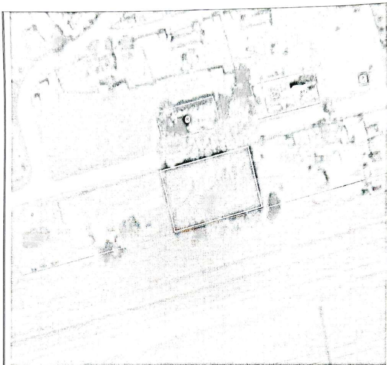
Схема использования земли на кадастровом плане территории