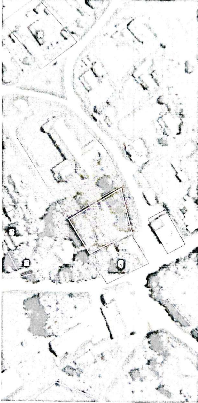
Схема использования земли на кадастровом плане территории в кадастровом квартале 29:18:060603