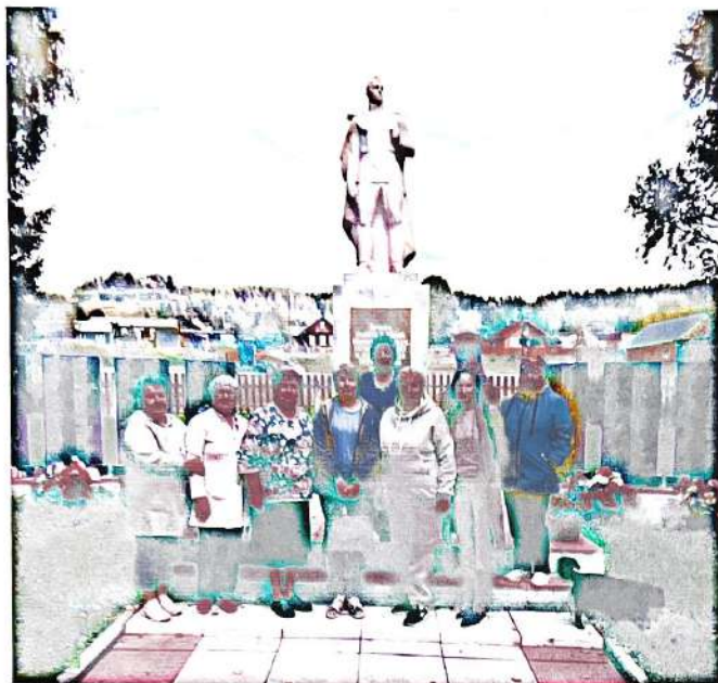
Презентация проекта «Поклон и память землякам» на сходе жителей. 24.08.2023 г.